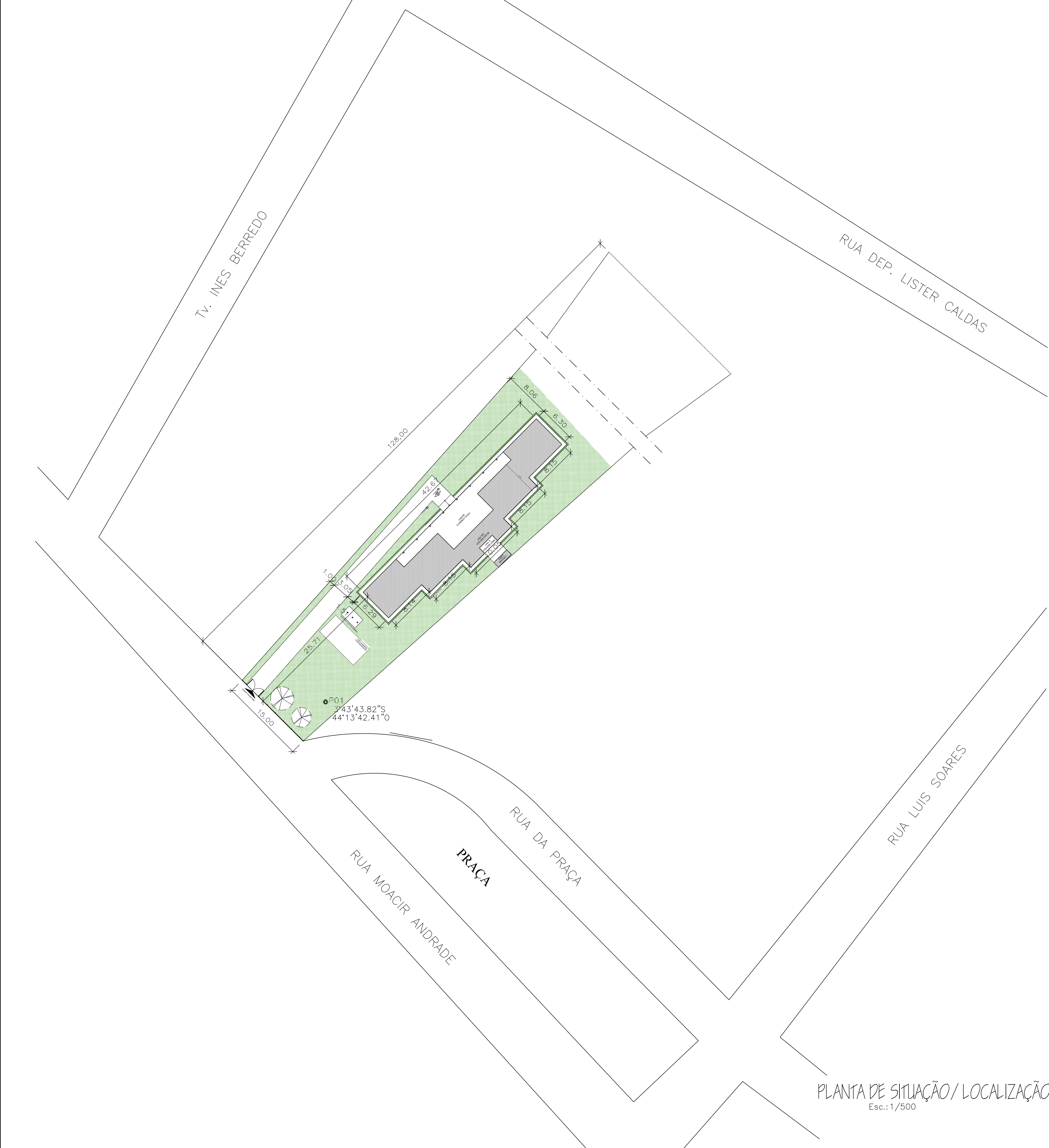
PLANTA DE SITUAÇÃO / LOCALIZAÇÃO Esc.: 1/500